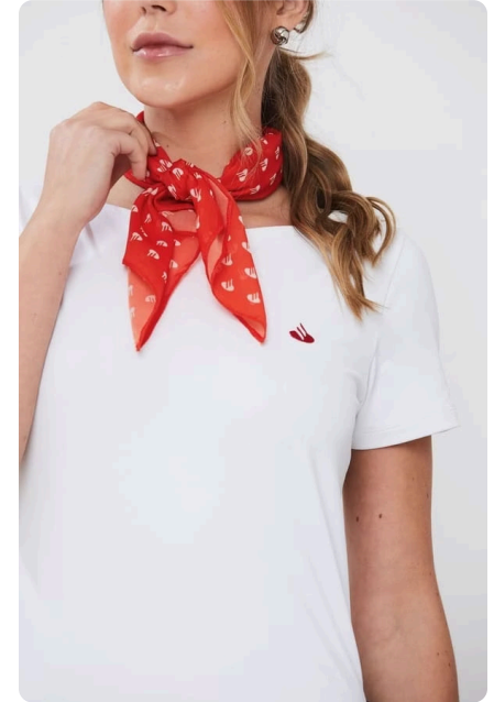
Blusa Suplex com lenço personalizado